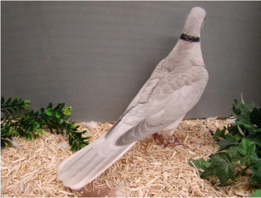
!48 Zeer slechte Grijs in alle opzichten