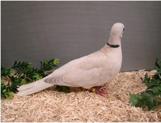
133 redelijke Grijs-Isabel