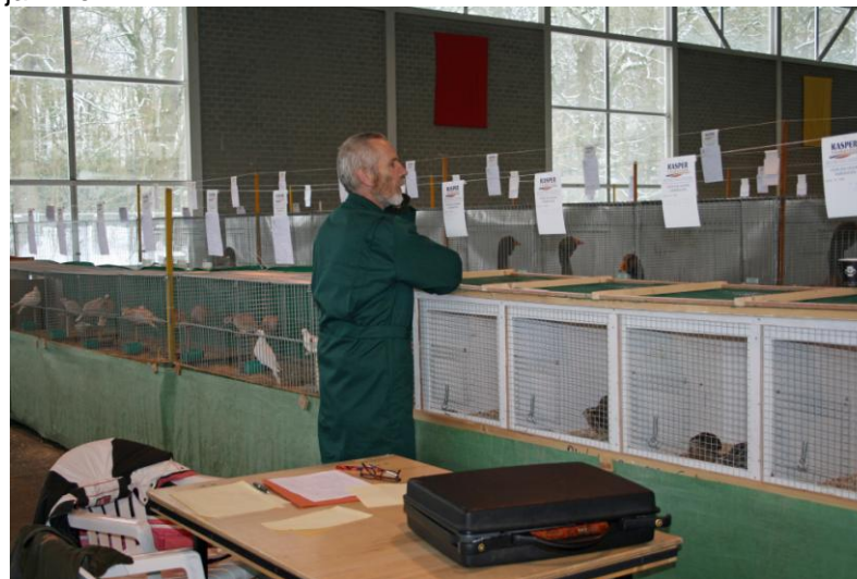
Foto: Een gesprek bij de kooien.

Het inschrijfgeld ligt hoog bij de Noordshow en een NE toekennen is dan erg jammer.