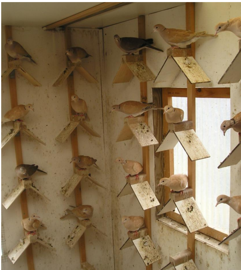
De groepshuisvesting van de jonge Lachduiven. Voldoende zitplaatsen om beschadiging te voorkomen zijn erg belangrijk.

Daar kwamen in 2002 Lachduiven bij. Wim werd lid van de DFKPclub en ging in 2003 naar de clubdag met zijn Pastel en Crème-ino Lachduiven. Het oordeel van Hein van Grouw maakte Wim niet blij: het waren goede dieren, maar de kleur was gebleekt en gevlekt doordat de dieren in een open volière te veel blootgesteld waren aan het zonlicht. Toch vond hij zelf de dieren niet goed genoeg en begon opnieuw met dieren die hij had aangeschaft bij Ernst de Haas en bij Jan Pijffers. Later kocht hij nog meer kleuren bij verschillende fokkers. In zijn streven de beste dieren op de tentoonstelling te brengen schroomt hij niet snel op te ruimen of fokmateriaal bij te kopen. Het fokmateriaal moet aan de hoge eisen voldoen die Wim stelt.