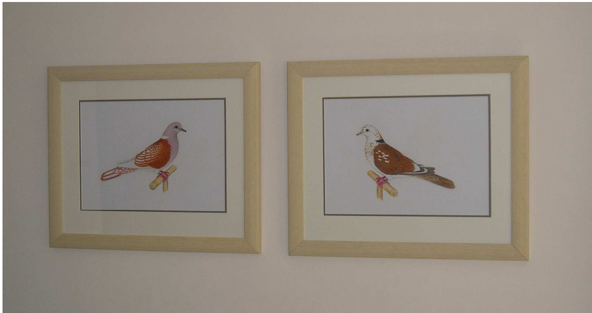
Twee originele pentekeningen van Jan Pijffers