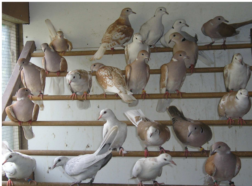
Een hok vol jonge lachduiven in 8 kleurslagen

Hierbij ontvangt u de uitnodiging voor de jaarvergadering op zaterdag 23 februari 2007 in het clubgebouw van de A.K.V. aan de Bokkeduinen 4 in Amersfoort. Korte routebeschrijving: A28 afslag Dierenpark Amersfoort, Dierenpark volgen, voorbij Dierenpark na 900 m rechts (= Soesterweg), na de bocht in de Soesterweg voor het N.S-rangeerterrein ligt het A.K.V.-clubgebouw aan de rechterkant. Telefoon A.K.V.-gebouw: 033-465522